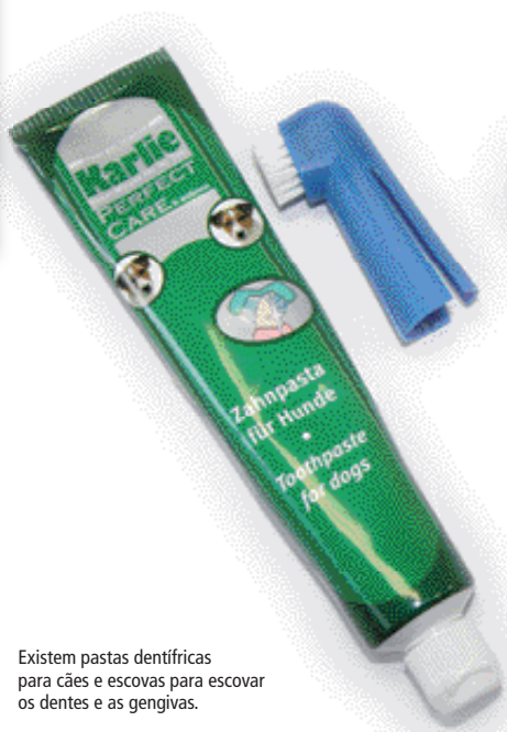
Existem pastas dentífricas para cães e escovas para escovar os dentes e as gengivas.

Quando a escovagem diária não é uma opção prática, existem outras estratégias alternativas a fim de manter a saúde oral dos cães, como o tipo de alimento e disponibilizar-lhes barras dentárias mastigáveis.